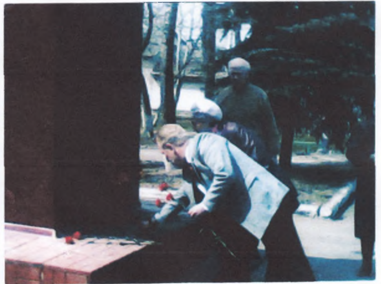
Возложение цветов к памятнику В.И.Ленину 22 апреля 2014 года .