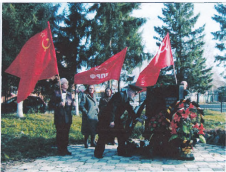
У памятника воинам –интернационалистам .