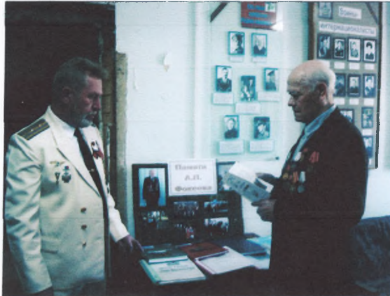
ФОТО-ФАКТ (или о делах опальных коммунистов )

На этих трёх „ китах „ 4 года держалась работа Городищенской районной партийной организации.