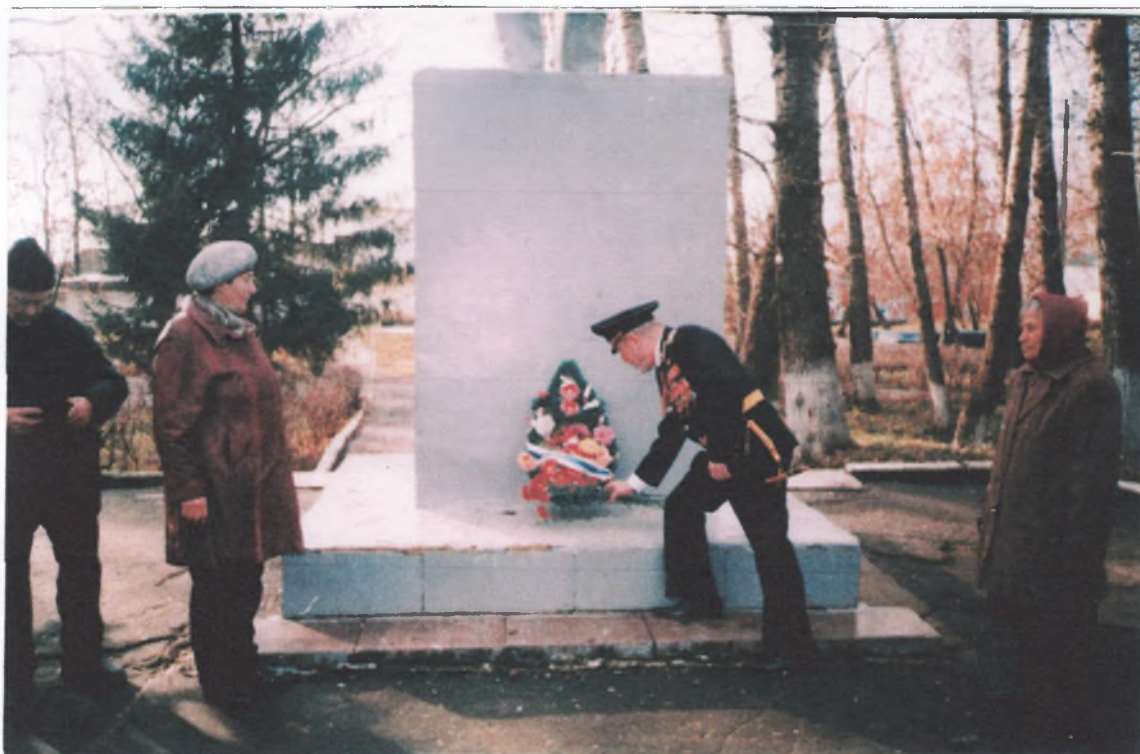
Возложение венков к памятнику В.И. Ленину 22 апреля 2013 года .